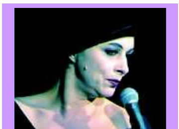
Charla Drops 16.11.

Die Säule / Goldstraße 15 / Duisburg-City Eintritt 11 / 9,50 €