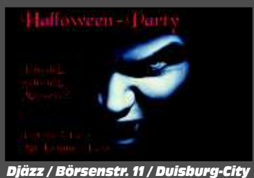
Djazz / Börsenstr. 11 / Duisburg-City